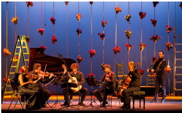
TEATRO GÓNGORA C/ Jesús María, 10