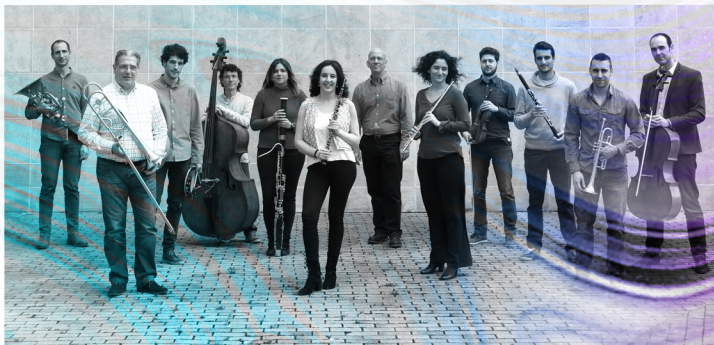
ENSEIC (Ensemble Instrumental de Cantabria)