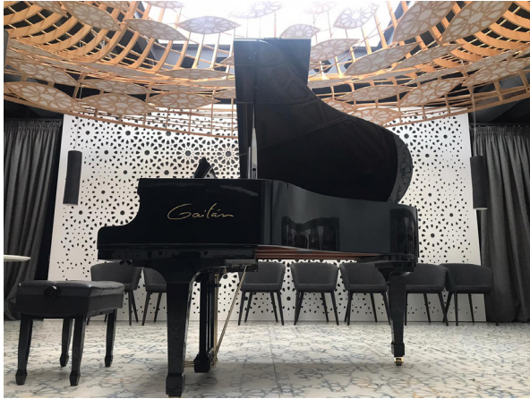
NOOR RESTAURANT C/ Pablo Ruiz Picasso, 8