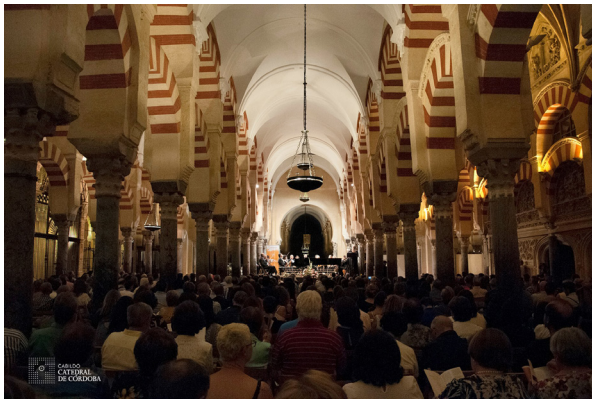
MEZQUITA - CATEDRAL C/ Cardenal Herrero, 1